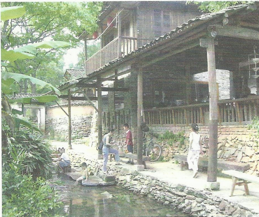
Een riviertje dwars door Sanbao werkcentrum (verkoeling!).