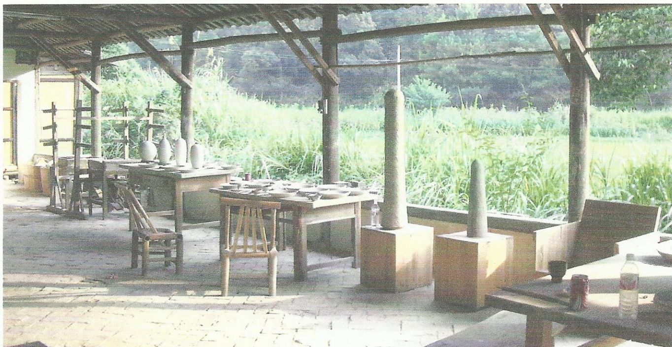
Eén v.d. ateliers, met zicht op rijstvelden.