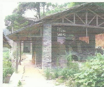
Zicht op anagama en achterliggende ateliers

Jingdezhen Sanbao Ceramic Art Institute, 14 Courtwright Road, Etobicoke, Toronto, ON CANADA M9C 4B4