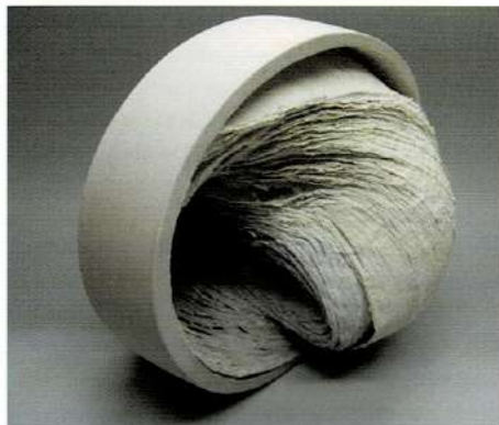
Foto rechts: Een Prijs van de Jury ging naar Yuhua Li (China): Chinese steen - 2 , met de hand opgebouwd steengoed, gereduceerd gestookt, 35 x 22 x 20 cm

Meer informatie over WOCEF en CEBIKO: www.wocef.com . Indien u een catalogus wilt bestellen, neem dan contact op met Jeonghee Choi: klara@kg21.net .